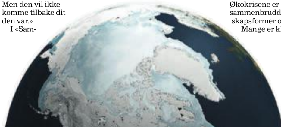
TOPP: Satelittbilder viser svingninger i den arktiske isen. Her fra mars 2011 ...