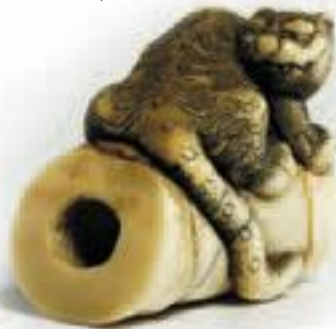
En netsuke – japansk miniatyr.

Eliten i Paris var på den tiden besatt av japanske gjenstander (japonisme), og Ephrussi-familien var altså en særdeles velstående en. De Waal vil spore familiens – og netsukenes – historie: «Jeg ønsker å vite noe om forholdet mellom denne gjenstanden av tre som jeg ruller mellom fingrene – hard og snedig og japansk – og hvor den har vært. ... Og jeg vil vite hvilke menneskers hender den har ligget i, og hva de følte for